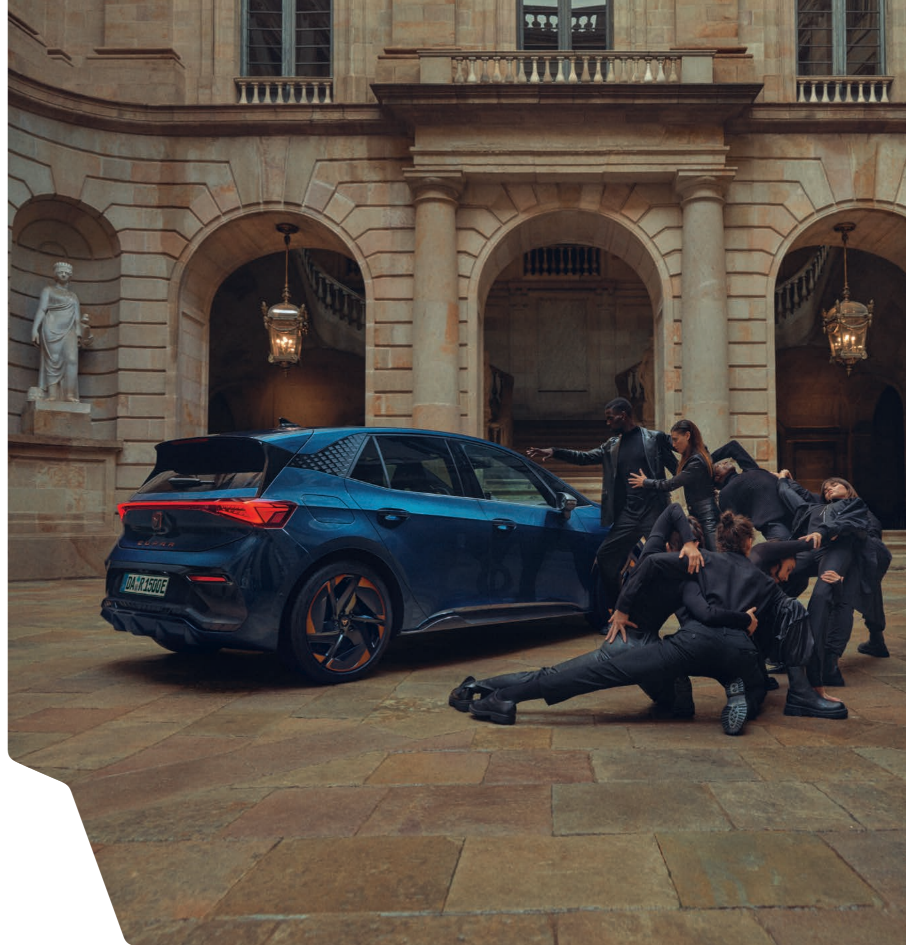
Abbildung zeigt 20"-Leichtmetallfelge Blizzard Black/Copper, die bis zum 02.04.2024 bestellbar ist.