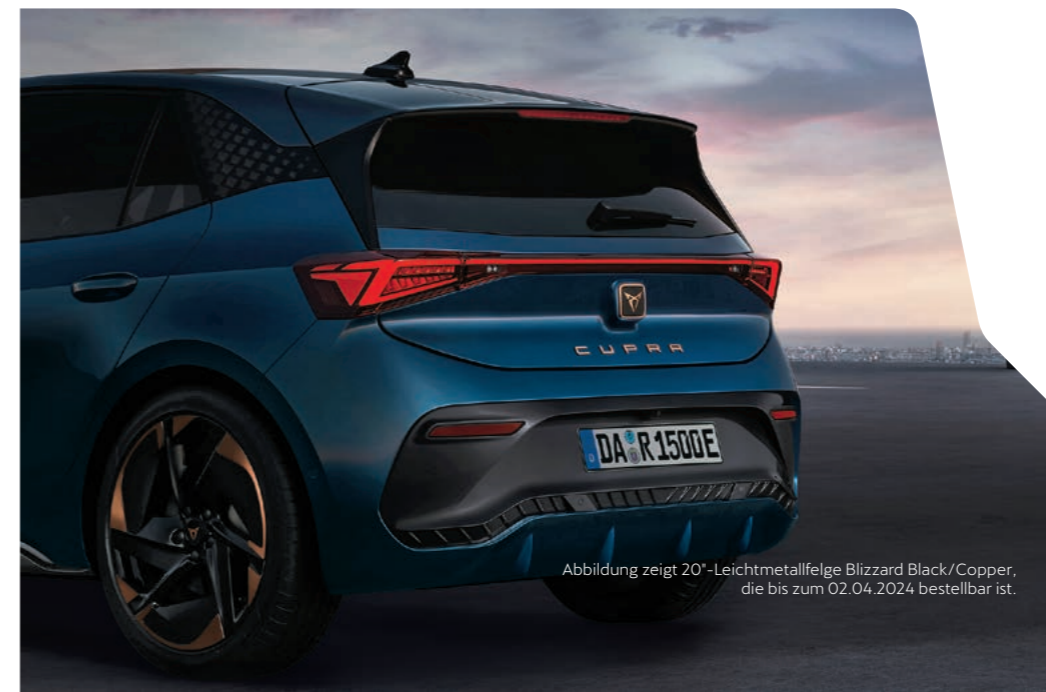
Abbildung zeigt 20"-Leichtmetallfelge Blizzard Black/Copper, die bis zum 02.04.2024 bestellbar ist.

Ein herausfordernder Geist formt seine Linien zu einem ungewöhnlichen Gesamtbild, das seinen Abschluss in einer auffallend sportlichen Heckansicht findet. Und diese werden andere wohl am häufigsten beim Fahren betrachten.